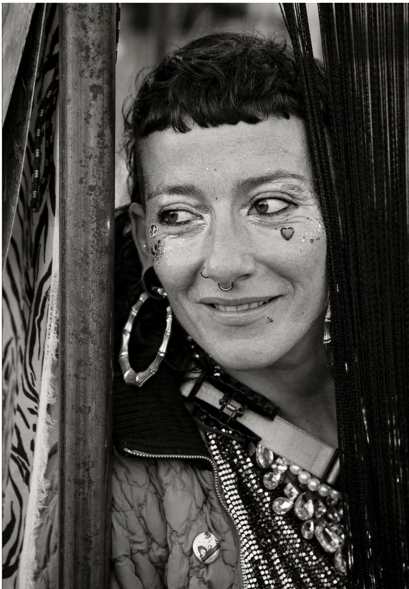
Cha: «Etre un humain, ce n'est pas écoresponsable»